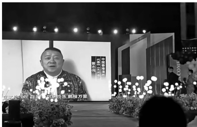
▲明星送祝福 视频截图；▶购物平台可以定制明星送祝福服务 网络截图

俨然，明星送祝福已明码标价形成产业链。祝福内容分对个人祝福或商业祝福，视频价格根据明星“咖位”从几百元到几十万元不等。11月20日，在一份中介提供的“明星祝福视频名单”中看到，杜晓东拍摄相关视频的价格为3000元一条，而曹查理为5000元。