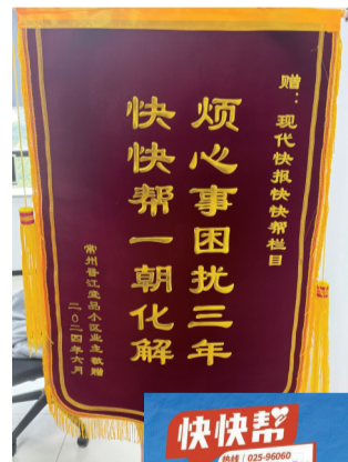
居民送锦旗点赞“快快帮”