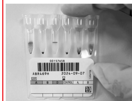
正反定型不符