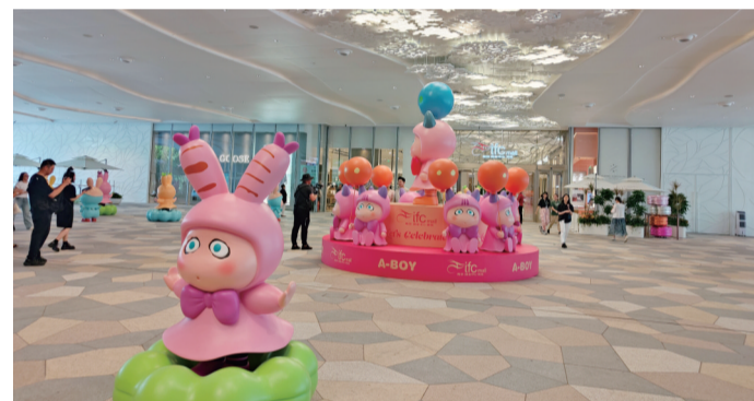
南京国金中心商场正式开业

顶奢大牌云集、全球特色珍馐汇聚、高科技互动体验……7月26日,南京国金中心商场(南京ifc商场)正式开业。现代快报记者了解到,南京ifc商场汇聚168个国际级高端时尚品牌及特色餐饮,吸引50个品牌进驻南京开设首店,为消费者演绎多元化的潮流购物体验。同时,南京ifc商场的开业,也意味着元通商圈进一步走向成熟,南京商业格局进一步向多商圈格局发展。