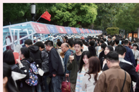
文创市集人气爆棚