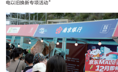
南京银行推出“刷脸”乘南京地铁服务