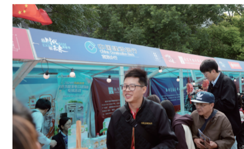
建设银行南京分行设置了“苏新消费·绿色节能家电以旧换新专项活动”

今年上半年,南京安居集团率先启动存量住房“以旧换新”试点活动,拉开南京存量房“以旧换新”序幕。国企出手收购存量住房,支持南京市民“以旧换新”。自“以旧换新”施行以来,南京掀起购房新热潮,不少楼盘带看量、交易量成倍增长。截至目前,安居集团共计16个新盘纳入“以旧换新”范围中。活动现场,安居集团旗下河西、雨花台、城北等区域的新盘,市民询问量大。据悉,本次试点活动将于2024年12月31日结束,名额仅有2000套,额满为止,有需求的市民抓紧。