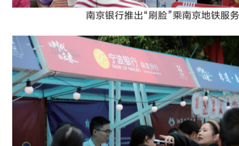
宁波银行南京分行向市民宣讲金融反诈知识