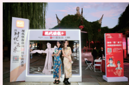
在绝佳打卡机位,穿上戏服“跨越时空”