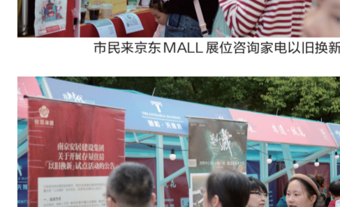
安居集团携河西中颐·天晟府项目介绍存量房以旧换新政策