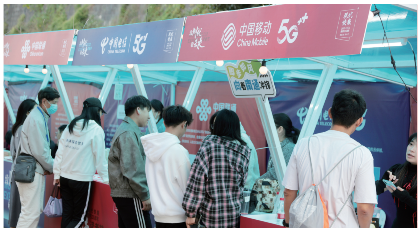
南京移动玄武泰淮分公司、南京电信分公司、南京联通泰淮分公司的活动吸引了大批市民

汽车家电以旧换新有哪些优惠、怎么补? 老旧房子如何换新,评估免费吗? 20日下午,“金融为民·绿色消费”专场活动开展,多家银行、三大运营商、家电和汽车品牌,以及房企纷纷亮相现场,围绕以旧换新、养老金融、数字消费等热点问题,为市民和游客进行解答,现场一站式送出多重福利。