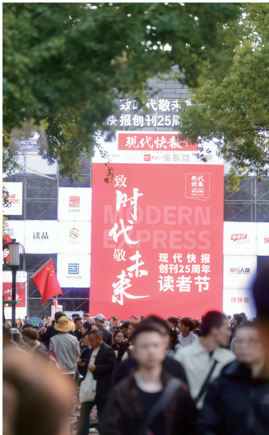
现代快报读者节吸引了大批市民

近年来不少博物馆一票难求,文博热持续升温。活动现场特别开设了文创市集。南京博物院、江苏省美术馆、南京古生物博物馆等13家博物馆,以及南京红山森