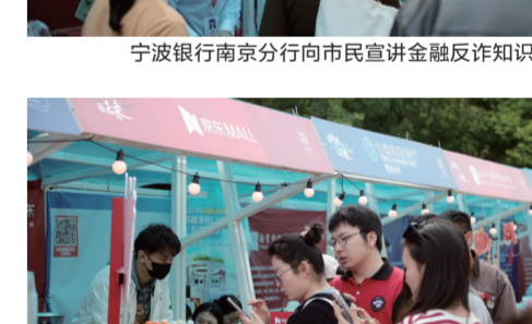
市民来京东MALL 展位咨询家电以旧换新