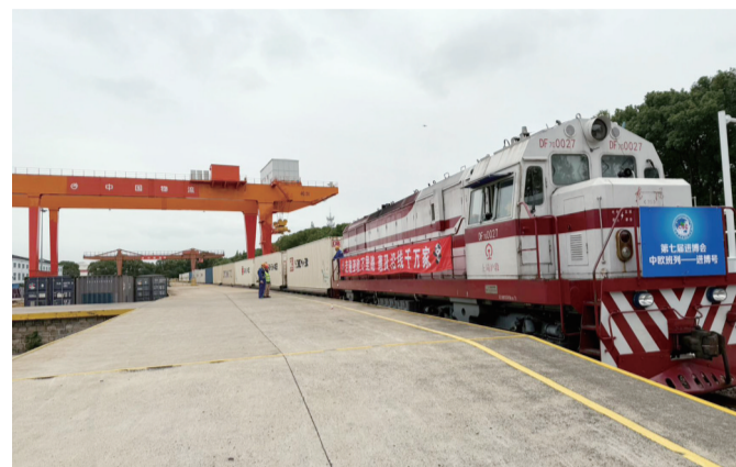
2024年首趟“中欧班列-进博号”抵沪

现代快报讯(通讯员 胡晓炜 钱永喆 记者 刘伟娟)距离第七届进博会开幕还有16天，10月20日上午，2024年首趟“中欧班列-进博号”(以下简称“进博号”)顺利抵达中国铁路上海局集团有限公司上海铁路物流中心闵行货场中储专用线。现代快报记者了解到，进博会参展展品已连续4年通过中欧班列直达上海。