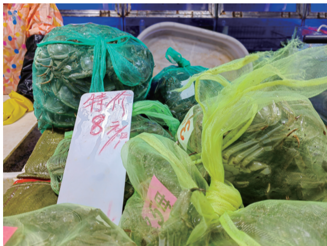
特价大闸蟹8元一只