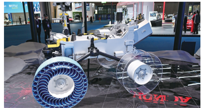
进博会汽车展区展示的米其林月球探测车轮胎