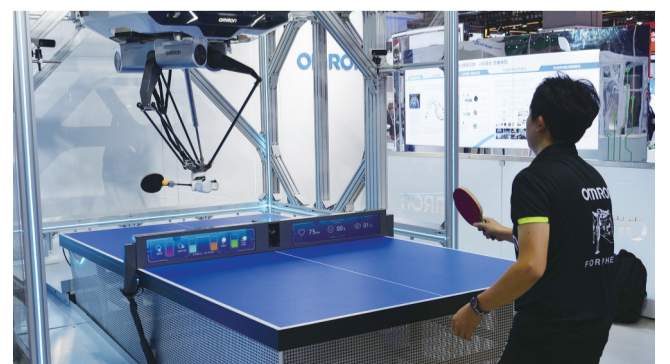
技术装备展区展示的欧姆龙乒乓球机器人