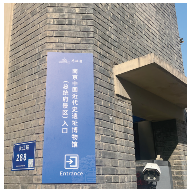
总统府景区新入口

现代快报讯(记者 裴诗语)12月17日,南京总统府景区原先的正大门(长江路292号入口),也就是标志性的门楼停止使用,新入口设于门楼西边约100米处的长江路288号,现场众多游客在工作人员引导下,有序从新入口进入景区。