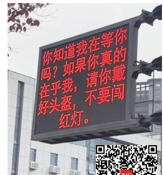
“花式”交通标语