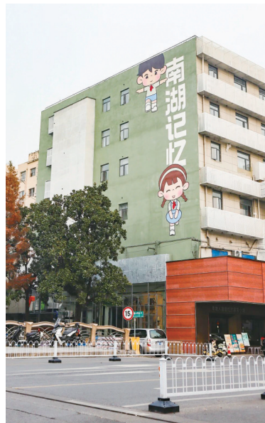
“南湖三期”正在改造中

现代快报讯(通讯员 建萱 记者 赵丹丹)经历两期城市更新后,南京“南湖记忆”街区已经变身一条复古又潮流的特色街巷,带你一秒重回20世纪80年代,吸引不少市民和游客前来打卡。12月17日,现代快报记者从建邺区获悉,目前,“南湖记忆”三期项目正在如火如荼地建设中,预计于2025年3月竣工并开业。