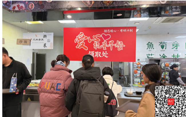
南航学子领取爱心能量早餐 扫码看视频

现代快报讯(通讯员 张鹤干 记者 于露)12月3日清晨6点半,南京航空航天大学将军路校区馨园书香餐厅内,“爱心能量早餐”窗口已经排起了队。同学们只需要花一分钱,就能领取一份爱心能量早餐。