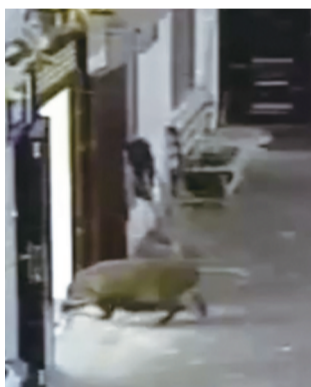
野猪夜巡公交场站 视频截图