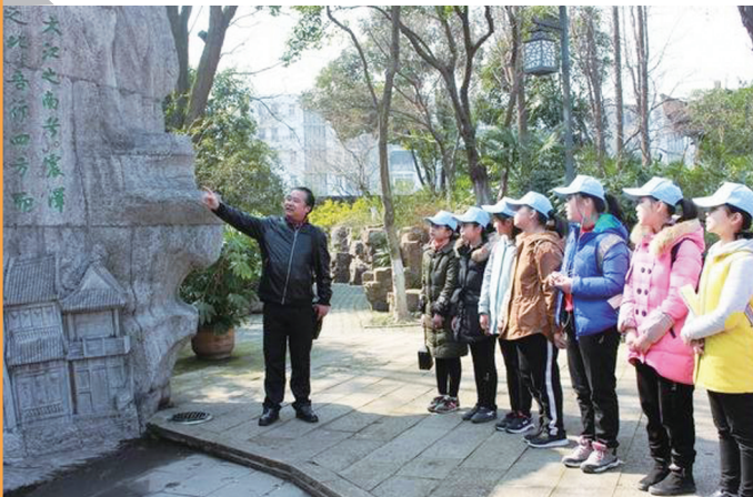
跟着楹联游常州采风活动

在常州市武进区戴溪小学，这所承载着深厚历史底蕴的百年老校里，楹联文化如春风化雨，滋润着每一名学子的心田。依托清代著名史学家、诗人赵翼的故里优势，戴溪小学积极创设楹联文化环境，大力开发实施楹联特色课程，在乡村学校少年宫创新开展楹联社团活动，全面提升学生传统文学素养，引领乡村孩子走进丰富多彩的文学世界。