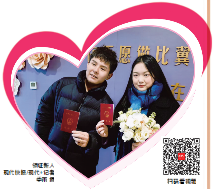
领证新人