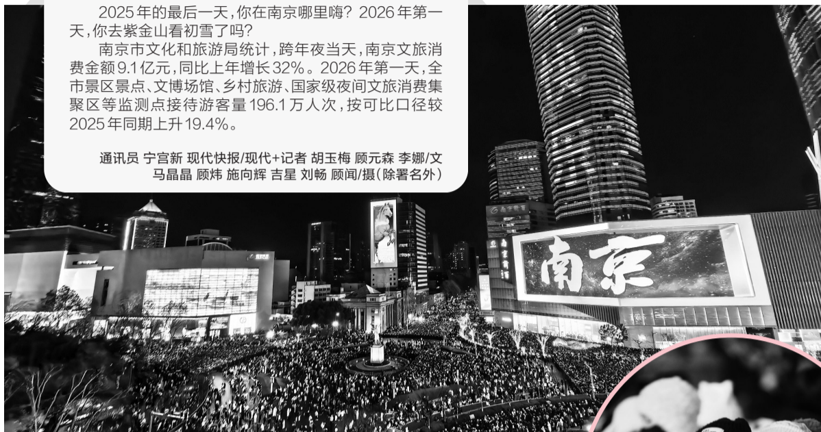
市民游客在新街口商圈迎接2026年到来

通讯员 宁宫新 现代快报/现代+记者 胡玉梅 顾元森 李娜/文