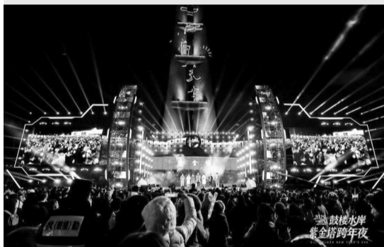
318米的紫金塔时隔30年再次亮起