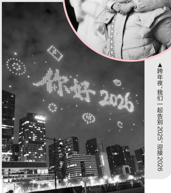
跨年夜,南京上演万架次低空飞行盛宴