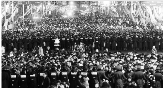
南京警方会同武警力量,用人墙守护平安有序