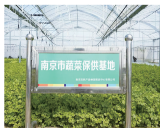
南京市蔬菜保供基地

上,或菜价出现持续性50%以上涨幅,以及收到市相关部门蔬菜应急投放指令时,市场将严格遵照上级指示,第一时间启动应急预案,有序组织蔬菜调运投放,全力保障市场供应稳定。