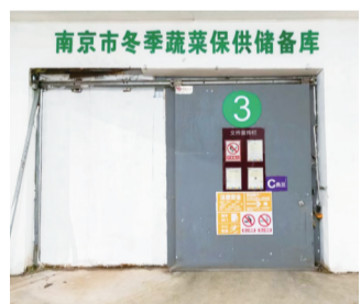
南京市冬季蔬菜保供储备库

南京众彩市场相关工作人员介绍,若遇冰冻雨雪等极端天气造成蔬菜运输中断,致使市场日均到货量较正常水平下降50%以