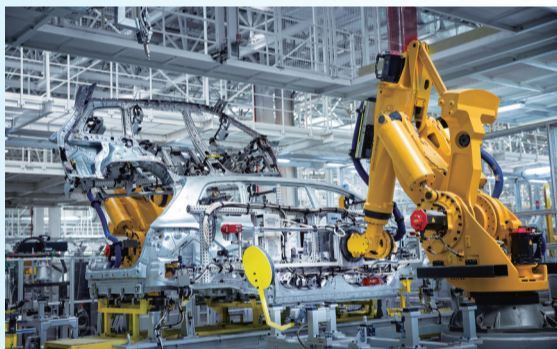
理想汽车常州智能制造基地