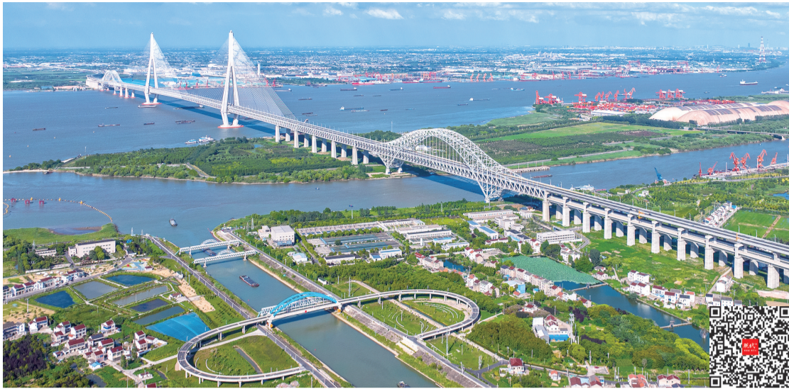
常泰长江大桥 扫码看视频