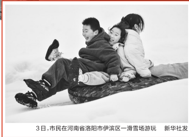
3日,市民在河南省洛阳市伊滨区一滑雪场游玩