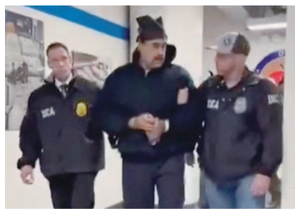
马杜罗(中)在美国缉毒局