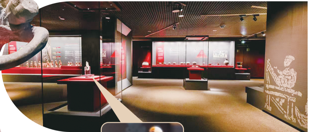
展览现场,“S”形玉龙佩在C位