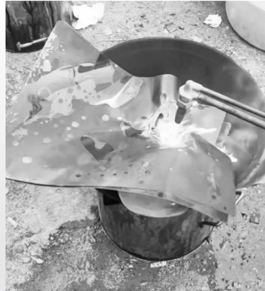
博主演示焚烧炼银过程 视频截图