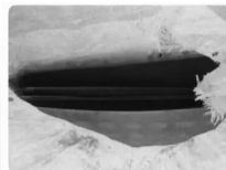
包邮 CT片,真片,蓝边, 40分钟前发布 ¥1215 1人想要 ■ 广元 卖家信用极好