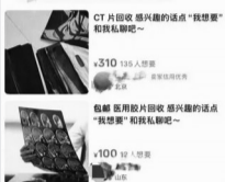
CT片回收 感兴趣的请点“我想要” “我想要”和我聊聊吧~ ¥310 15人想要