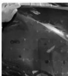
包邮 医院CT片一批, 蓝片 21小时前发布 ¥168 2人想要