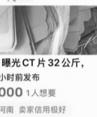
包邮 曝光CT片32公斤, 3小时前发布 ¥10000 1人想要