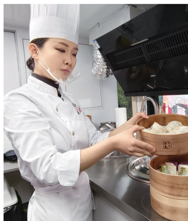
扬州早茶名企治春为美食巴士提供早茶