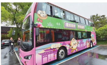
扬州首条美食巴士即将上线