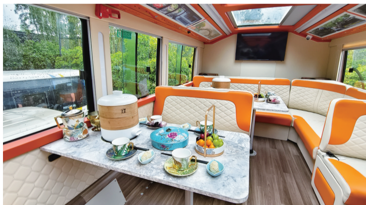
巴士二层的观光用餐区