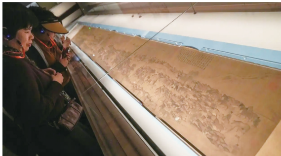
参观者在李公麟《摹韦偃牧放图》卷前驻足