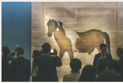
郎世宁《阉虎骝图》轴