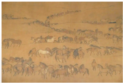
李公麟《摹韦偃牧放图》卷局部