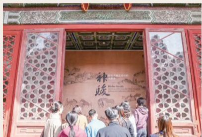
“神骏：故宫书画艺术中的马世界”展厅门口