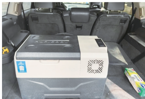
用以接收冰雹样本的移动冰箱