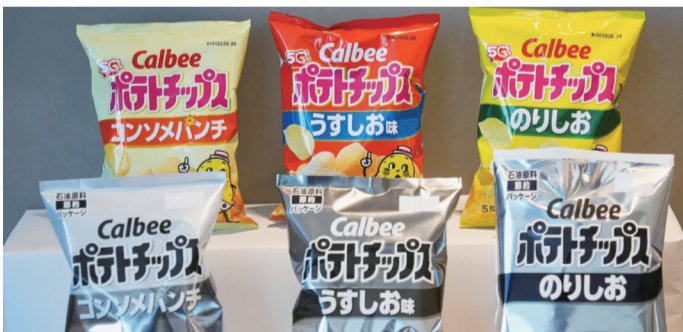
卡乐比薯片包装改变前后

可果美公司是日本最大的番茄酱生产商，所产番茄酱包装设计40多年未变，为白色底色上印有大量西红柿图案。可果美公司表示，由于近期油墨供应持续紧张，公司无法寻找替代方案，决定从5月下旬起将番茄酱包装改