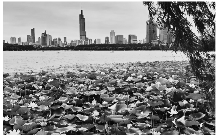
6月13日,相对清凉,未来几天要开始热了

6月14日20时至15日20时,14日20时—15日08时,东南部地区阴有时有小雨,其他地区多云到阴。15日08时—20时,东南部地区多云到阴有时有小雨,