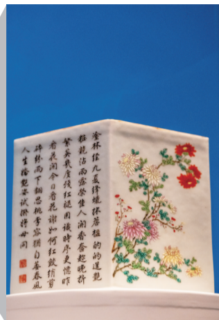
清乾隆粉彩花果御题墨诗六角瓷笔筒