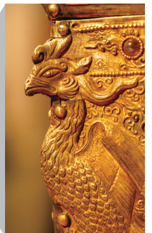
鎏金七宝阿育王塔

端午节去哪儿玩?6月18日,朝天宫红墙黄瓦间文脉氤氲、新意涌动。“数见苏韵·家门口看大展”环省行第二季(南京站)暨第24届南京市“文博之夏”系列活动启动仪式在南京市博物馆(朝天宫)举行。13个设区市15家博物馆精选出来的20多件国宝级文物,让南京人在家门口免费看个够。