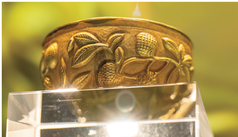
元代刻铭荔枝纹金套碗