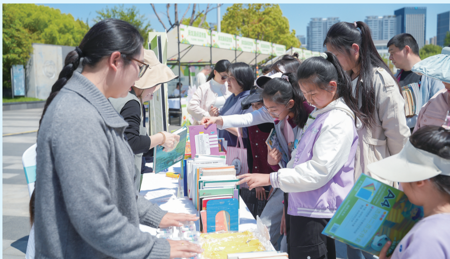
阅读市集