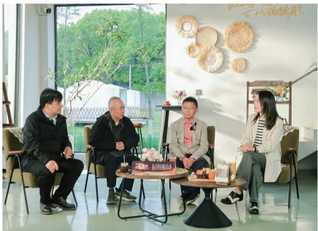
《一个文学的午后》春日特别活动

全域覆盖背后是扎实的阵地支撑。2025年，新北区创新推出基层“悦”读空间改造计划，10个镇（街道）各遴选1家重点书屋开展个性化提升，提供1万至3万元改造补贴。孟河镇南兰陵农家书屋突出“红色主题、齐梁文化、孟河医派”特色；代英书院以“代英主题刊物命名功能空间”；西夏墅镇秋白书苑匠心铺陈“江苏省最美公共文化空间”……全方位满足群众多元阅读需求。