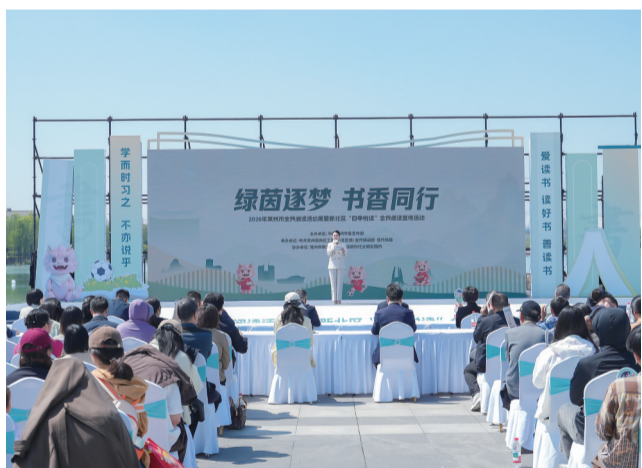
2026年常州市全民阅读活动周暨新北区“四季悦读”全民阅读宣传活动

东坡文化不再是书本里遥远的文字，而是青年创业的灵感、职场解压的良方、孩子成长的课堂、家庭传承的家风，成为可感可触的日常。