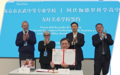
搭建国际交流桥梁

学校深耕爱的教育特色德育品牌，坚持五育并举、三全育人，涵养师生文雅品行。以“劳动光荣、技能宝贵、创造伟大”为价值引领，构建“专业+劳动+美育”特色课程群；以党建引领“立德树人”，强化责任担当，构建“校—院—班”三级管理体系，发挥学生会自主管理作用；构建“校、家、社、安”协同体系，为学生成长筑牢防护网。