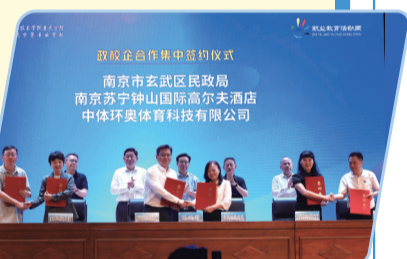
政校企合作成效显著