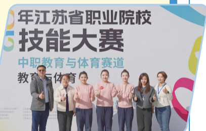
技能大赛勇夺金牌