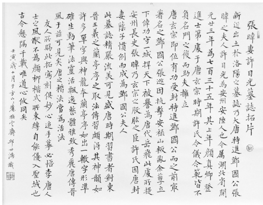
拓片 楷书题跋69x122cm 2012