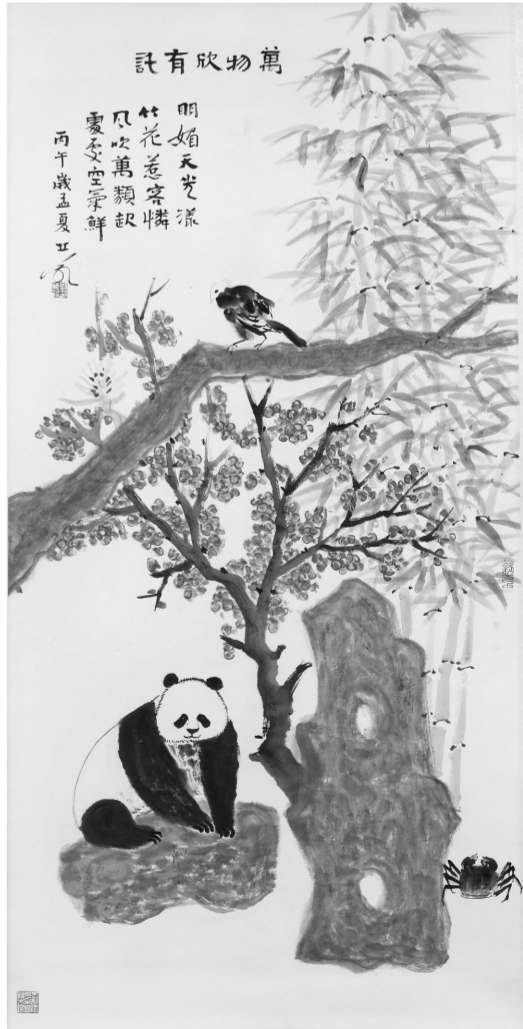
国画中堂 万物欣有託 69x138cm 2026