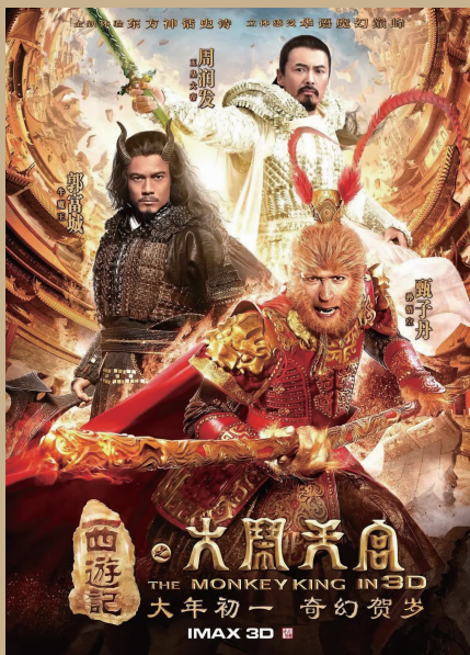
《西游记之大闹天宫》