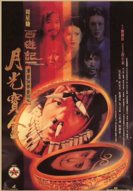
《大话西游之月光宝盒》

这三部曲均有不错的票房成绩，然而《西游记之大闹天宫》中接近西式魔幻的剧情设定、“金刚”形象的孙悟空，《西游记之孙悟空三打白骨精》中反派白骨精的超重戏份，以及《西游记女儿国》里对孙悟空的边缘化，使得该系列口碑不尽人意。