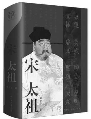
2023年9月 广东人民出版社 《宋太祖》 顾宏义著

秦皇汉武、唐宗宋祖。但是，在大多数人心目中，宋太祖的功业逊于前三者。其实不然，宋太祖不仅终结了五代乱世，而且他创立的“尚文抑武”的国策，成为儒学的基本理念，深远影响了宋代及以后各朝的统治者、士大夫阶层与民间百姓的观念。顾宏义深耕宋史领域，这部691页、50.7万字的《宋太祖》是他的代表作。全书史料翔实，详略得当，围绕论点步步推导。阅读该书，对于赵匡胤以及宋代的奠基当有明晰深入的理解，尤其能理解赵匡胤所采取的“尚文抑武”国策的起因、过程及方方面面的影响。书中指出，周世宗与属下反复商议，终于形成了“先易后难”“先南后北”的统一战略，以及具体的执行计划。这与赵匡胤建立宋朝以后所采用的统一策略有着直接的渊源关系。该书第五章，详细描述了赵匡胤“雪夜定策”、北御契丹、收荆湖、平后蜀、灭南唐、取南唐、三征北汉的武功。这两段史料前后呼应，证明了赵匡胤统一中国的功业伟绩，也证明了赵匡胤擅长吸收好的经验、避免坏的教训，更证明了赵匡胤深切地知道，只有在国力富强、军备完整的基础上，才有可能实施“尚文抑武”。作者明确指出，尚文抑武，即通过尚文来达到抑制武人势力的目的，这是相对于唐末五代时期重武轻文而言的，并非是说宋太祖轻视武事。鉴于五代乱政以及自己“黄袍加身”的经历，宋太祖十分重视对禁军的控制，他通过“杯酒释兵权”成功解决了大将专制兵权问题，又建制度分离掌兵权与发兵权，并逐步剥夺了节度使的兵权、财权和人事权，从而将兵权集中于天子之手。抑武，不是废弛武力，而是削弱地方武装的控制权，将兵权牢牢控制在中央手中。可惜，随着岁月的推移，“强干弱枝”逐渐显示了负面的后果，赵宋子孙唯有赵匡胤这样的才干和控制臣属的手段，募兵制造成的冗兵现象大量消耗了国力，这是后世称宋朝“积贫积弱”的一大原因。赵匡胤生于乱世，历经辛酸：契丹的铁蹄踏碎了汴梁城，他饥饿数日，沦落到要偷寺庙的苜蓿；投奔父亲的旧友，反被羞辱驱逐；想靠博彩赢钱，却被混混围殴抢走……直到投奔郭威，才勉强取得一席安寝之地。这段身处底层的三年流浪之旅，让他遍尝人世艰辛而深刻体会生活安稳的幸福向往，深藏体恤百姓之心，他希望臣民们能有安稳的日子。赵匡胤认为，不能再走五代迭更的暴力屠戮之路，那只会结怨世人，大失民心，让王朝短命。赵匡胤誓庇佑柴氏子孙，接着，杯酒释兵权，以柔腕的处理方式，以宽容的姿态，消解了可能的危机，也使他获得了士大夫的信任和拥护。作者说，赵匡胤作为一员武将，行军统兵，冲锋陷阵，本是其当行本色，但与当时其他将领不同，他对文士颇为礼重，故其幕府中才俊汇集，皆乐为之用。书中描述了赵普、楚昭辅、王仁瞻等人的才干，尤其是赵普的辅助之能，黄袍加身、杯酒释兵权等大事，皆出于他的主谋策划。宋代建国后，一系列政治、军事、经济、文化制度的建立，也都是以赵普为首的士大夫定下的基调，如此一来，赵普难免专权跋扈，而宋太祖对赵普防范的方法，是通过其所倚重的原幕府成员控制的枢密院来分散、架空赵普的权力，从君臣相处来说，宽厚至极，却也给了赵普后来倒向赵光义的机会。宋太祖盟誓“不得杀士大夫及上书言事人”，顾宏义引述张荫麟的论析，指出这种做法“实养成士大夫之自尊心，实启发其对于个人人格尊严之认识。此则北宋理学或道学精神基础之所由奠也”，但同时埋下“言官之强横，朝议之嚣杂，主势之降杀，国是之摇荡”的祸根。宋太祖“尚文抑武”的国策对后世的影响，评议者褒贬不一，仁者见仁智者见智。