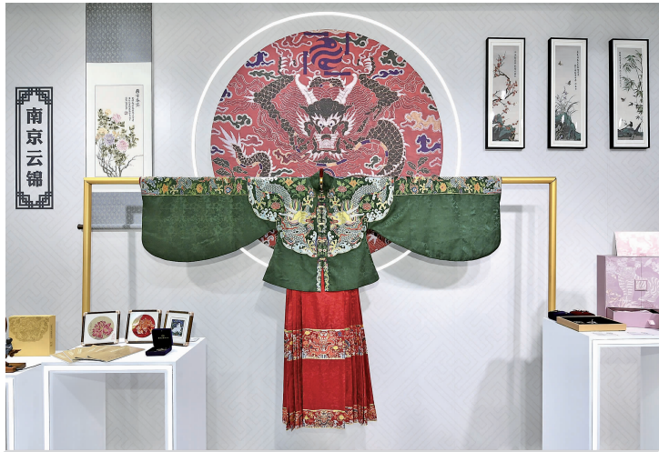
南京云锦妆花吉服