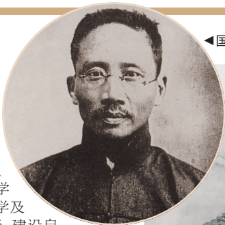
◀国立中央博物院筹备处第一任理事长蔡元培