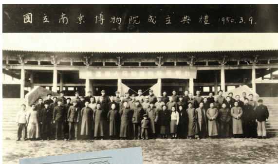
国立南京博物院成立典礼