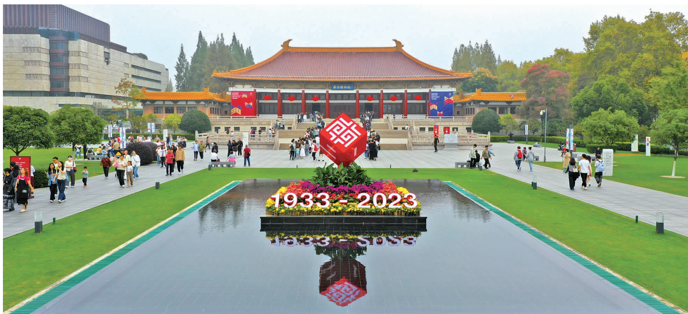
南京博物院迎来九十岁“生日”