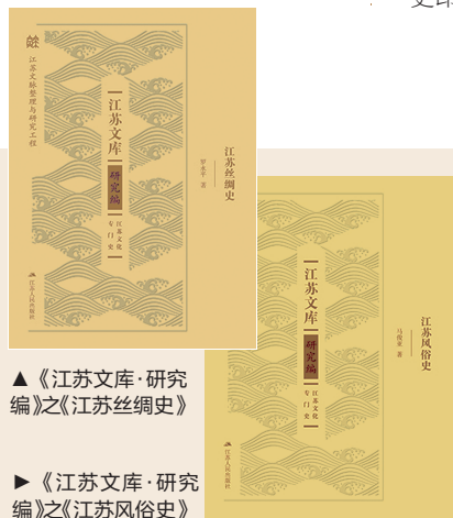
▲《江苏文库·研究编》之《江苏丝绸史》

这些老街巷中或许早已不见当年的营生,但在老地名里依然可以窥见600多年前的“大明风华”