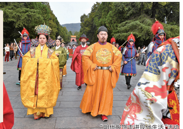
“明代服饰走进现代生活”活动