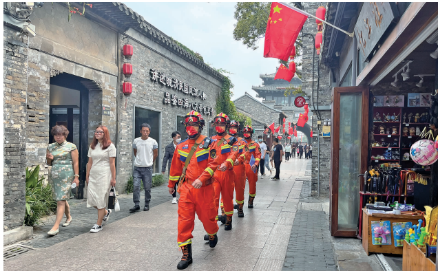
开展古城消防巡逻