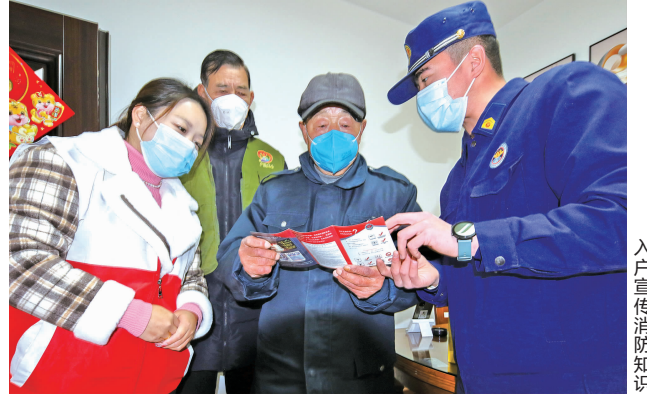
入户宣传消防知识