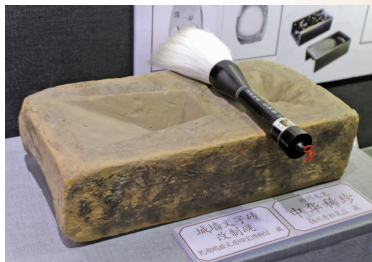
城墙文字砖改制砚和中华珍稀扬州毛笔