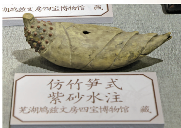
仿竹笋式紫砂水注