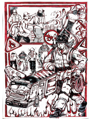
高邮中专 2207 童彤