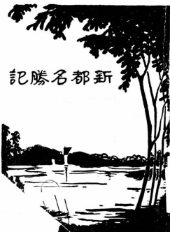
《江苏文库·史料编》之《新都名胜记》

香林寺就是“铁槛寺”的原型。上世纪七十年代，人们还发现了“香林寺庙产碑”，上面写着：“前塑造部堂曹大人买施秣陵关田二百七十余亩，和州田地一百五十余亩。”