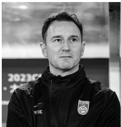
国足主帅扬科维奇

中国男足即将开启第13次冲击世界杯之旅，目前国足正在深圳集结备战。16日，他们将迎来2026世界杯预选赛亚洲区36强赛首战客场与泰国队的比赛。国足大名单选择标准是什么？首场与泰国一战将如何准备？在首个主场将以怎样的姿态挑战强大的韩国队？对世界杯出线目标是否依然信心十足？日前，国足主帅扬科维奇接受了新华社记者的专访。