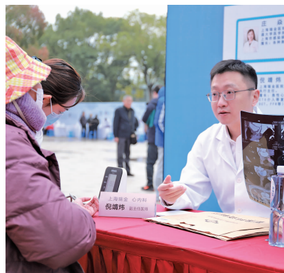
上海瑞金医院无锡分院