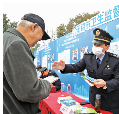
无锡市卫生监督所