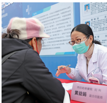
无锡市妇幼保健院