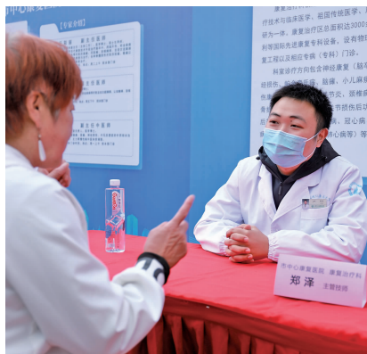
无锡市精神卫生中心(无锡市中心康复医院)