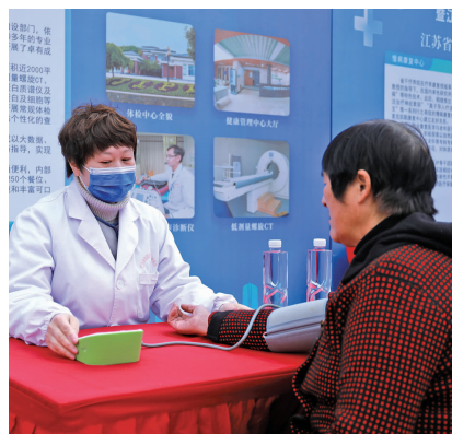
江苏省血吸虫病防治研究所