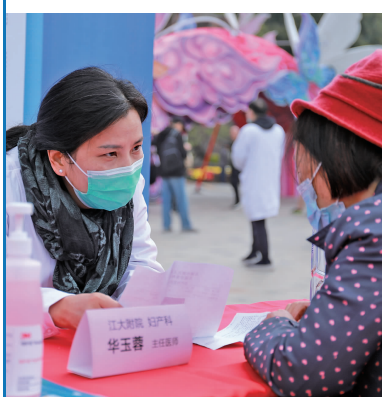
江南大学附属医院