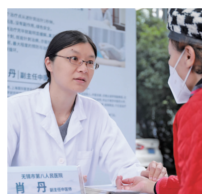
无锡市第八人民医院