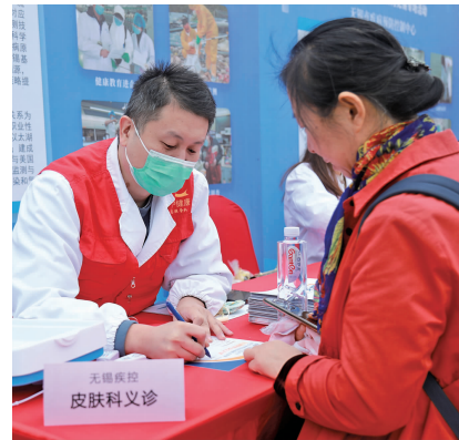
无锡市疾病预防控制中心