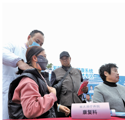
江苏省太湖疗养院(江苏省太湖康复医院)