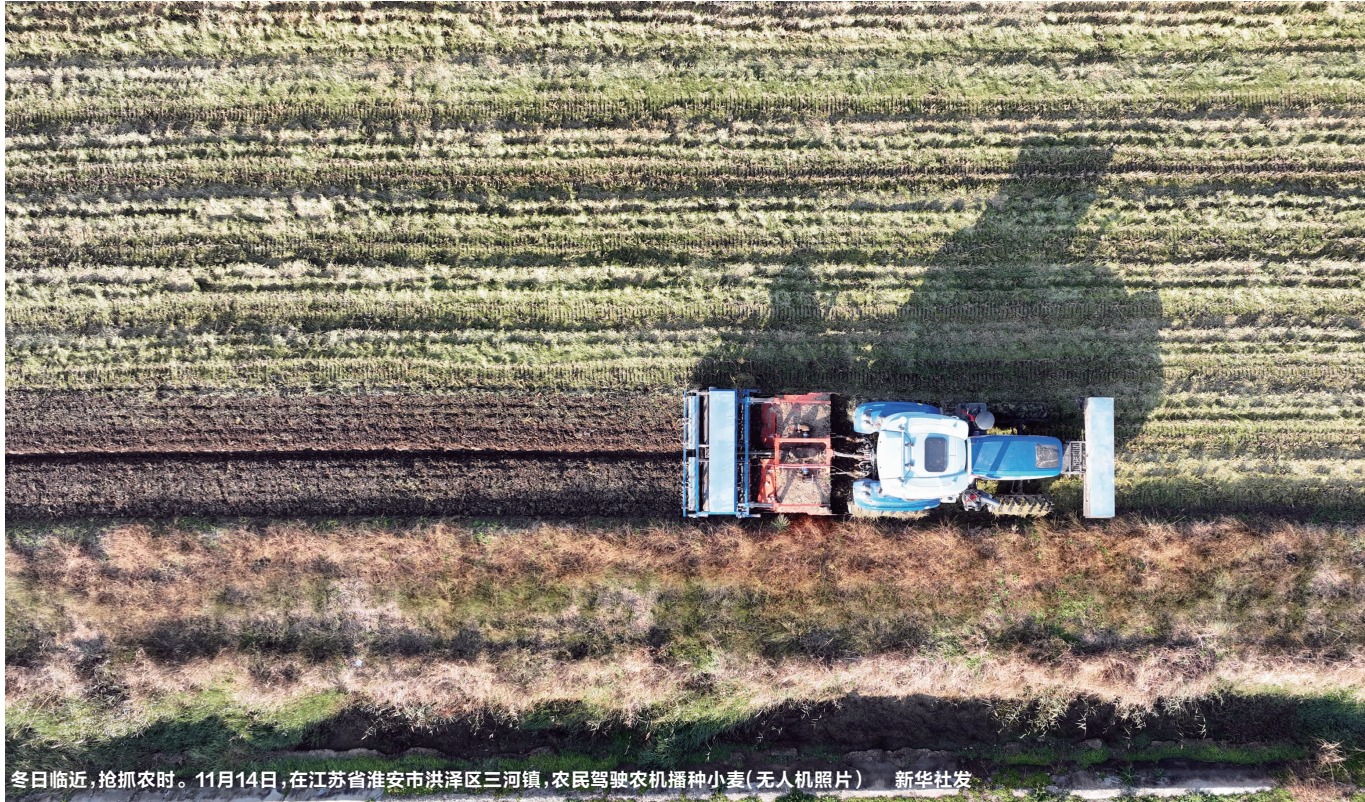
冬日临近,抢抓农时。11月14日,在江苏省淮安市洪泽区三河镇,农民驾驶农机播种小麦(无人机照片)