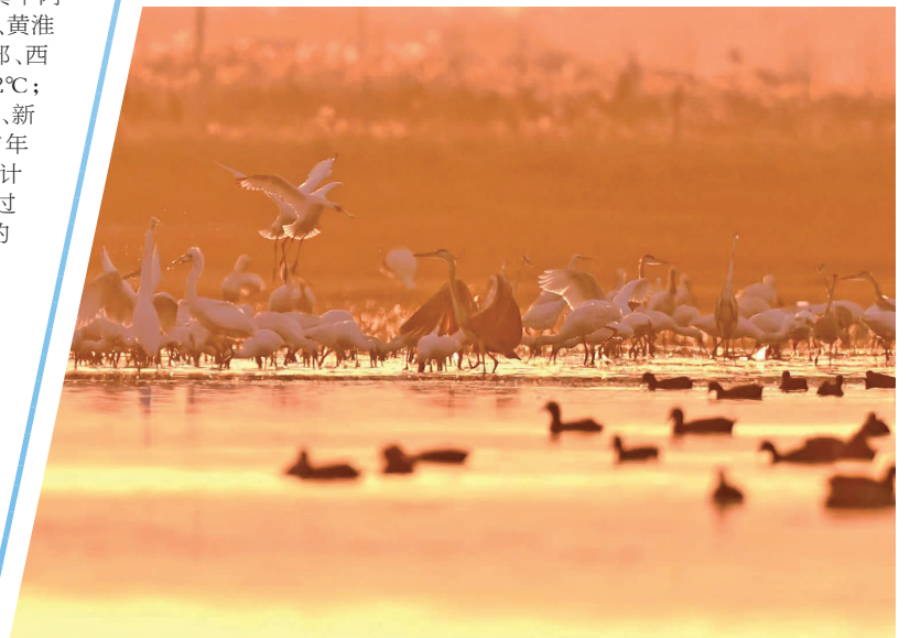
条子泥湿地和谐的画面