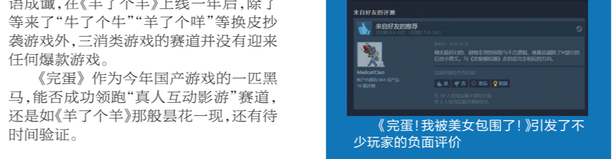
《完蛋！我被美女包围了！》引发了不少玩家的负面评价