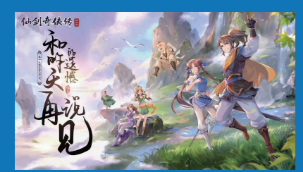
中手游将把旗下国民级IP《仙剑奇侠传》系列授权给小有内容