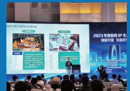
中手游官宣《天呐！我被仙剑包围了》