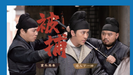
《神都不良探》游戏截图