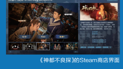
《神都不良探》需要玩家参与解密