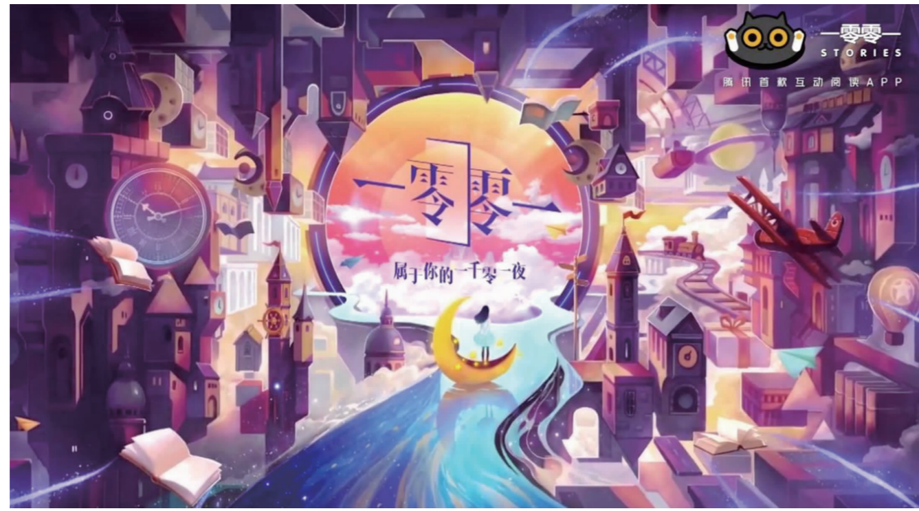
集互动视觉小说、互动漫画、互动剧为一体的《一零零一》互动阅读平台