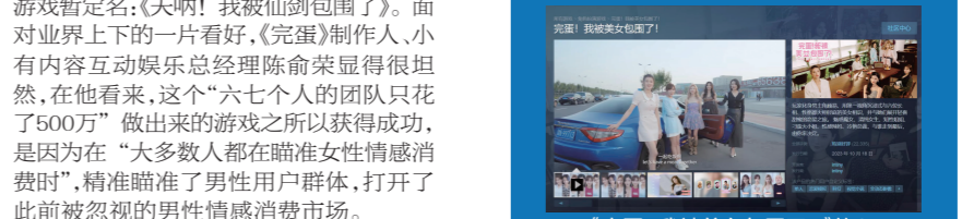
《完蛋！我被美女包围了！》的Steam商店界面