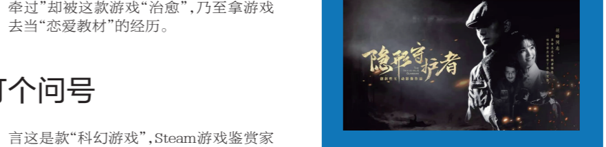
《隐形守护者》的剧情介绍更为出彩