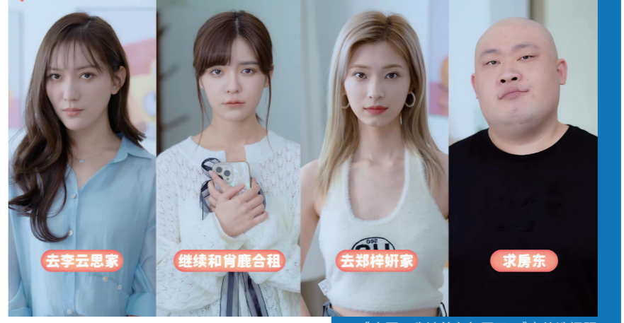
《完蛋！我被美女包围了！》中的选择项