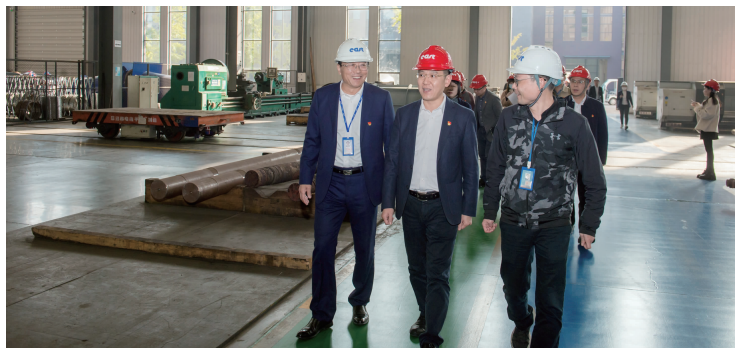
苏锡通园区产业链走访