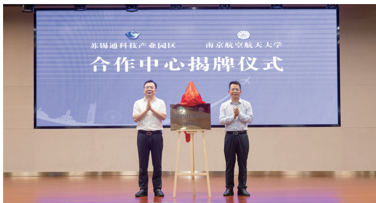
苏锡通园区和南京航空航天大学合作中心揭牌