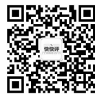
扫码获取更多内容

份孝心也扩散开来。有爱的父母,有爱的媳妇儿,有爱的老板……不论谎言还是真相,都足以让温暖蔓延。“10元自助餐”,善意的谎言在左,有爱的亲情在右,这是给当代儿女上的最好的一堂亲情课。 现代快报评论员 灵灵么