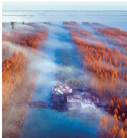
▲东台黄海森林公园航拍图