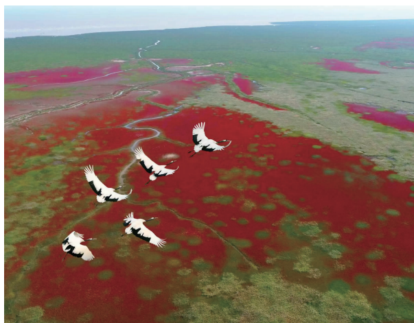
盐城珍禽自然保护区