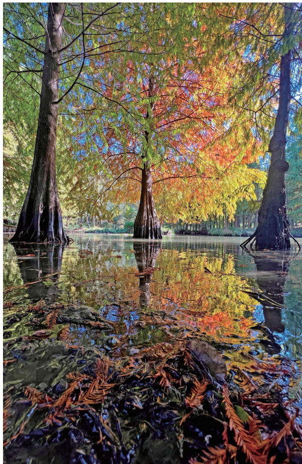
南京钟山风景区燕雀湖