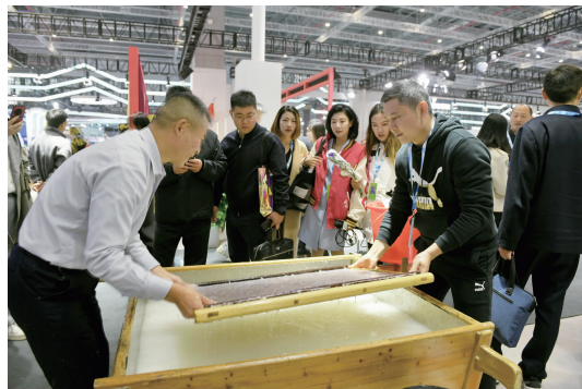
非遗传承人带着观众体验宣纸制作