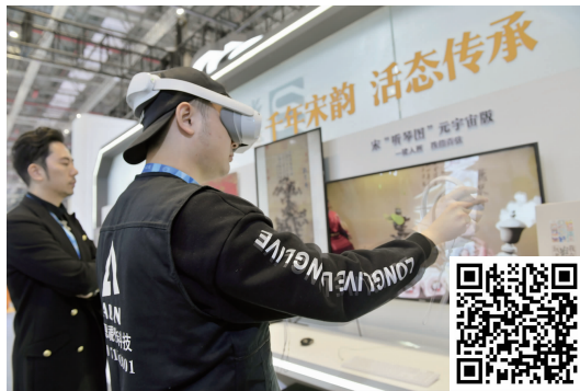
观众体验听琴图元宇宙 扫码看视频