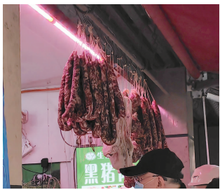
西白菜园的某商户使用了“生鲜灯”