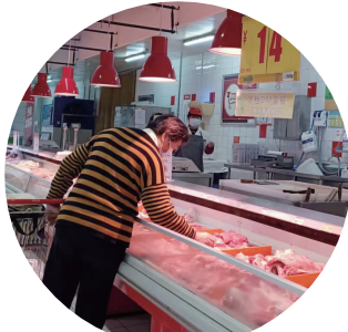
秦淮区一超市鲜肉档口的“生鲜灯”