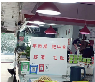
鼓楼区鼓楼街菜场