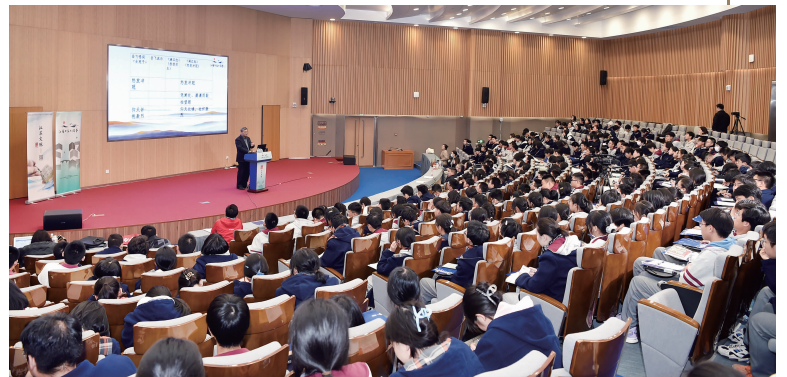
江苏文脉大讲堂现场