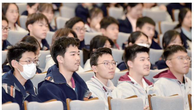
南京市第一中学的学生听得津津有味