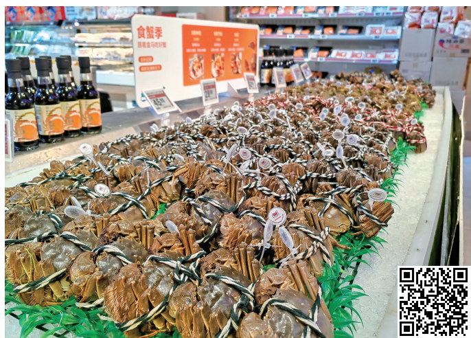
超市在售的大闸蟹 扫码看视频