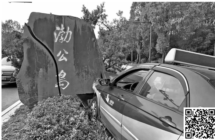
事故现场(扫码看视频)

渤公岛取名于渤公,是为纪念治水先贤张渤而取名,原先是一条长1700米的棧山大堤,后结合退渔还湖工程,建设成为集水利工程、自然风光、人文景观于一体的渤公岛生态公园,是蠡湖36公里环湖观光带的重要景点。在建筑西路渤公岛入口处,刻有“渤公岛”三字的石头已立了十多年,是进入渤公岛的显著标识。