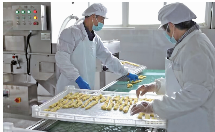
现代快报记者走进徐州新沂一家预制菜工厂,了解生产过程 资料图片

参照国家市场监督管理总局《食品经营许可和备案管理办法》,草案修改稿第十八条中增加了一款,作为第二款,对食品展销会举办者提前报告相关事项的信息作出规定,拟要求食品展销会的举办者应当于展销会举办的五个工作日前,向所在地(市、区)食品安全监督管理部门报告食品经营区域布局、经营项目、经营期限、食品安全管理制度以及入场食品经营者主体信息核验收