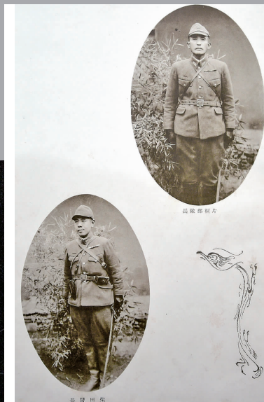
侵华日军片桐部队军士长的相册