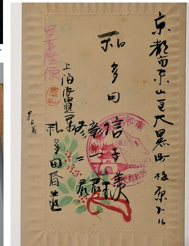
日军士兵1938年元旦发自南京的明信片

安全区的真实场景。照片中,难民身上破衣烂衫,脸上仍有恐惧的神情。1938年12月的法国《竞赛》杂志