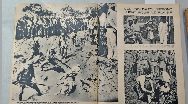
1938年12月法国《竞赛》杂志中,刊发的南京大屠杀的图文报道