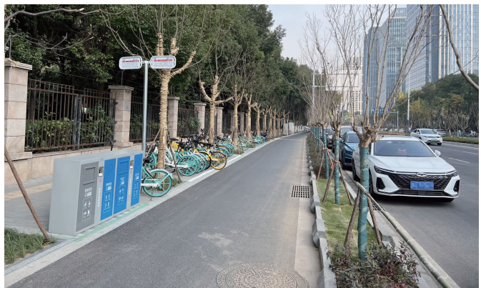
公交“新城科技园地铁站北”站一边站台与机动车道之间隔着绿化带