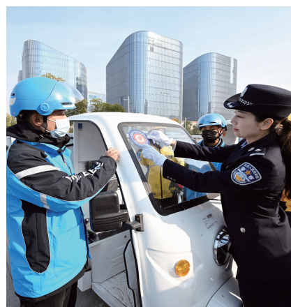
外卖小哥化身“平安小哥”

现场民警告诉现代快报记者,所有“平安守望点”均装有统一logo的灯箱,配备专门的防护器具,并在高德地图上进行标注,方便群众第一时间找到最近的“平安守望点”,获取避险、报警等服务。“外卖快递员小哥的加入是我们‘平安守望点’的新鲜血液,他们将和我们一起,开展巡逻、救助群众、见义勇为等工作,让快递员传递南京的平安温度。我们也希望更多的单位和个人加入‘平安守望点’大家庭,为平安南京建设添砖加瓦。对及时上报信息、帮助救扶、打击犯罪等符合奖励条件的,我们将及时进行奖励。”南京市公安局治安支队相关负责人表示。