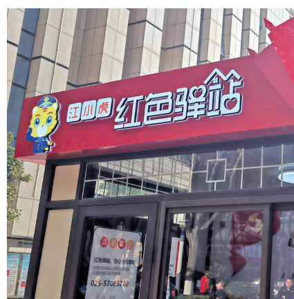
江小虎红色驿站

快报讯(通讯员 徐晶晶 记者 杨晓冬)“现在天气越来越冷了,但这个地方给我们带来不少温暖。”11月29日,现代快报记者来到南京市江宁区大厂街道长冲步行街,空调、饮水机、微波炉、充电器……步行街内的“江小虎红色驿站”成了外卖员、环卫工等户外劳动者的“避风港”。据悉,江宁区第一批12个服务站点已全部完工并投入使用,实现了红色驿站在江宁区全域覆盖。